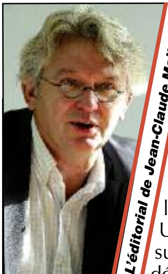
L'éditorial de Jean-Claude Mailly